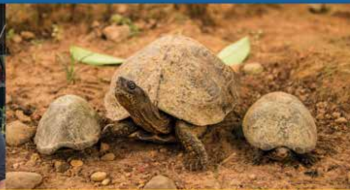
Programa de Conservación de Tortuga de Río