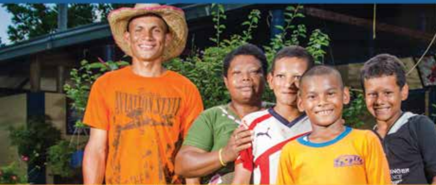
Familia beneficiada con el programa Parcelas Agroforestales

que se traduce en acciones para beneficio de las comunidades y el entorno