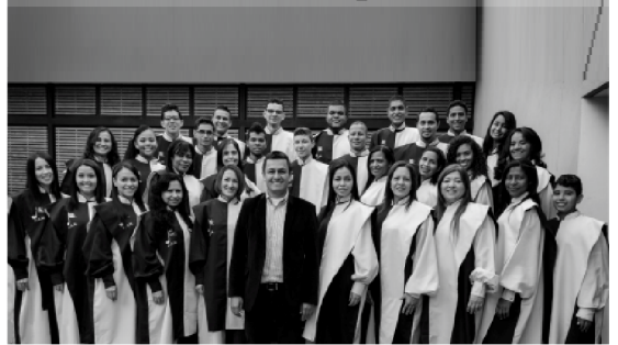
Director: Dahir Bocanegra Moreno