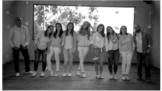
Grupo vocal femenino