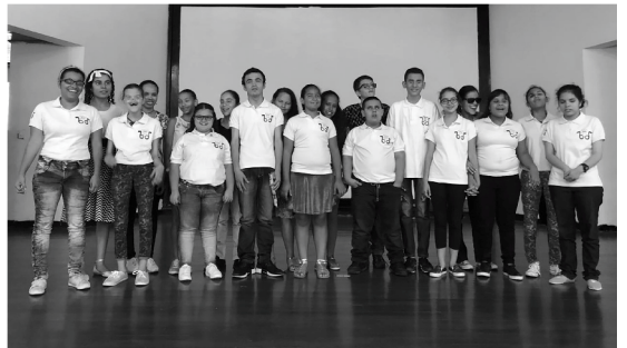
Director: Fabio Terán López