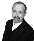
Director: Jerzy Augustynsky Stalowa Wola

El Coro de Cámara del Centro Municipal de Cultura de Stalowa Wola es un grupo multigeneracional de 33 aficionados fundado en 1985. Su repertorio incluye una gran variedad de música: contemporánea, folk, jazz, adaptaciones de música popular, piezas de ópera y musicales, así como otras representaciones teatrales.